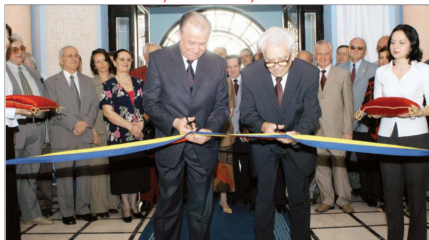
Tăierea panglicii inaugurale