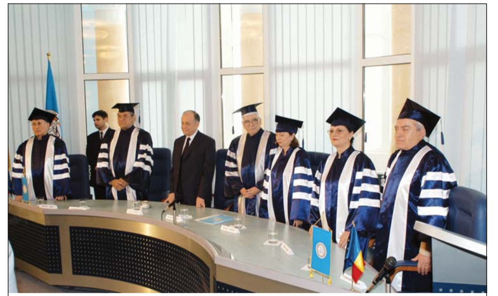
Solemnitatea decernării titlului academic