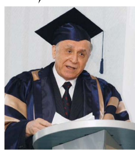
Domnule Rector, Stimați membri ai Senatului Universității Spiru Haret, Onorată asistență, Doamnelor și domnilor,

Alocuțiunea domnului Ion ILIESCU, Președintele României