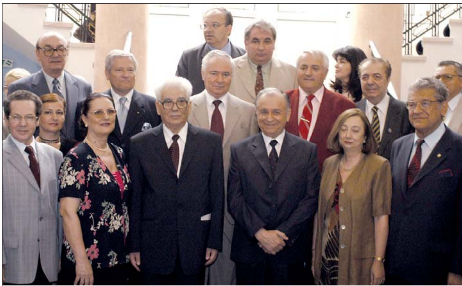
Împreună cu membri ai Senatului Universității Spiru Haret