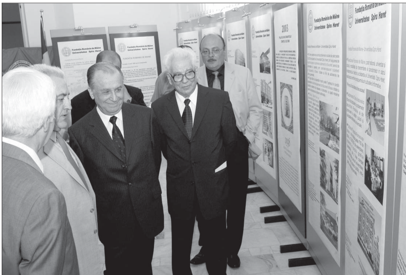
În mica expoziție cu fotografii și cifre – imagine convingătoare a evoluției Universității Spiru Haret și a direcțiilor de dezvoltare în viitor

Pentru a marca acest moment deosebit, vă rog să-mi permiteți să dezvelim placa, ce consemnează inaugurarea Palatului Învățământului, Științei și Culturii, în prezența Președintelui României, domnul Ion Iliescu.