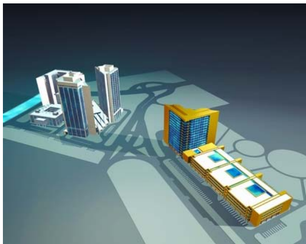
Privire din ansamblu