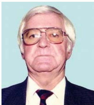
Prof.univ.dr. Corneliu Dumitrescu Decanul Facultății de Arhitectură, București