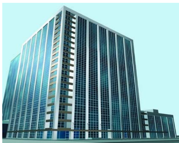
Spitalul clinic universitar