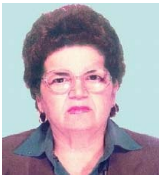
Prof.univ.dr. Rodica Trandafir Decanul Facultății de Matematică-Informatică, București