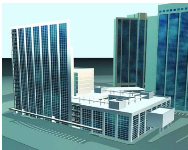
Hotel pentru visiting professors Complex hotelier pentru studenti Centru de conferințe