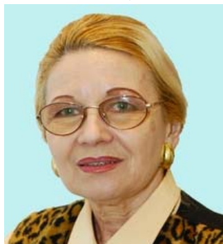
Conf.univ.dr. Lucia Mureșan Decanul Facultății de Teatru, București