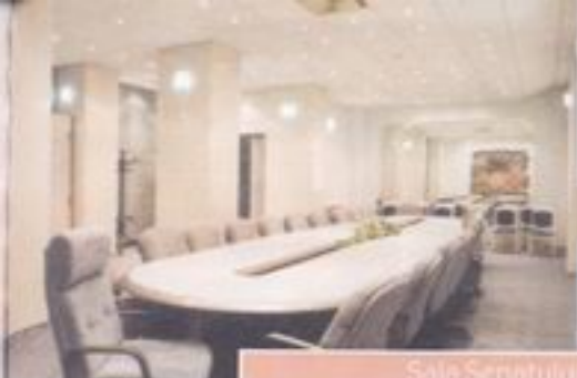
Sala Senatului și a Consiliului Universității