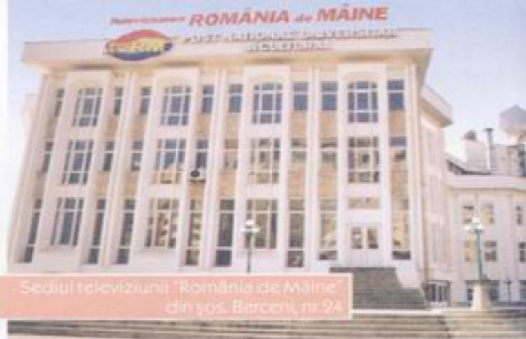
Sediul televiziunii "România de Măine" din șos. Berceni, nr. 94