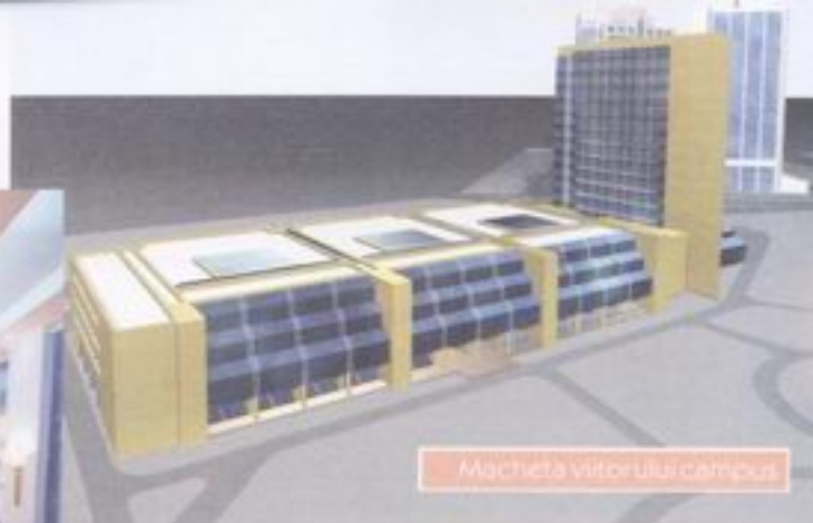
Macheta viitorului campus