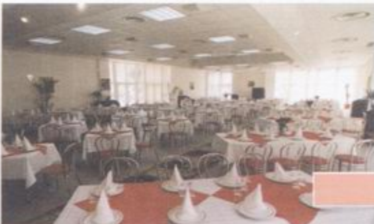
Cartina și căminul universității "Spiru Haret"