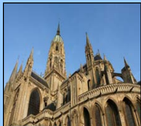
Cathédrale de Bayeux

Cursul intensiv de limba franceză se adresează studenților și absolvenților Universității Spiru Haret, studenților altor universități, specialiștilor din alte domenii academice, dar și oricăror alte persoane interesate.