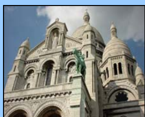
Basilique du Sacré Cœur